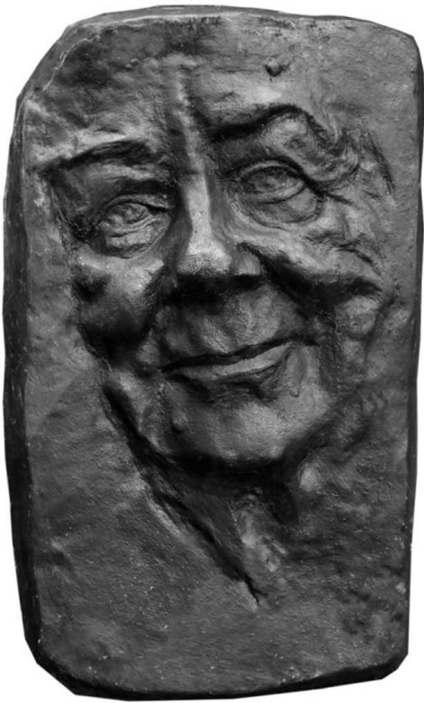
Wzrost: 160 cm, waga: 50 kg, kolor włosów: ciemny, kolor oczu: ciemny, data urodzenia: 1920, data śmierci: 1979, przyczyna śmierci: choroba serca, grafika